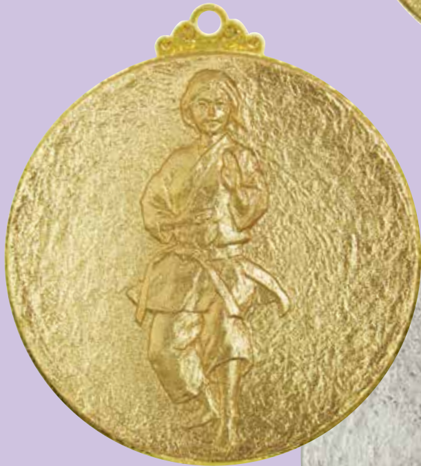
A80-185-金 形空手 女