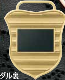
Zkメダル裏 (プレートは金・銀・銅とも黒色です)