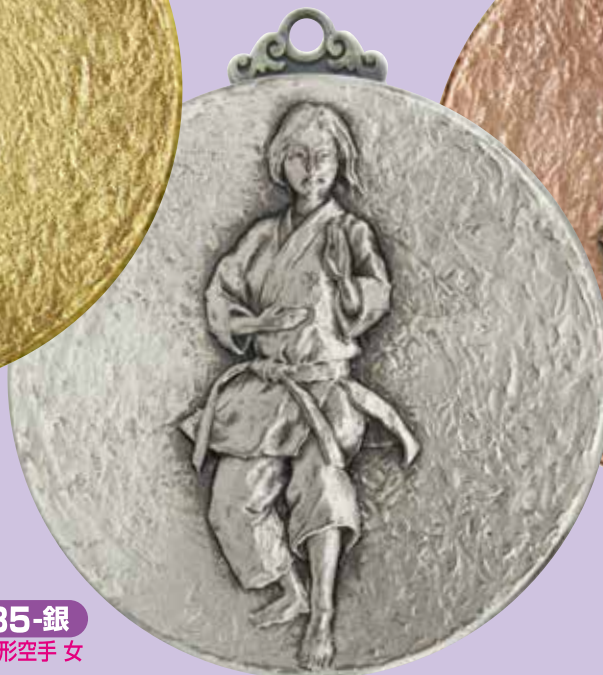
A80-185-銀 形空手 女