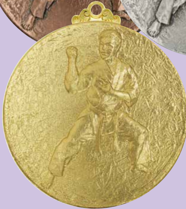
A80-184-金 形空手 男