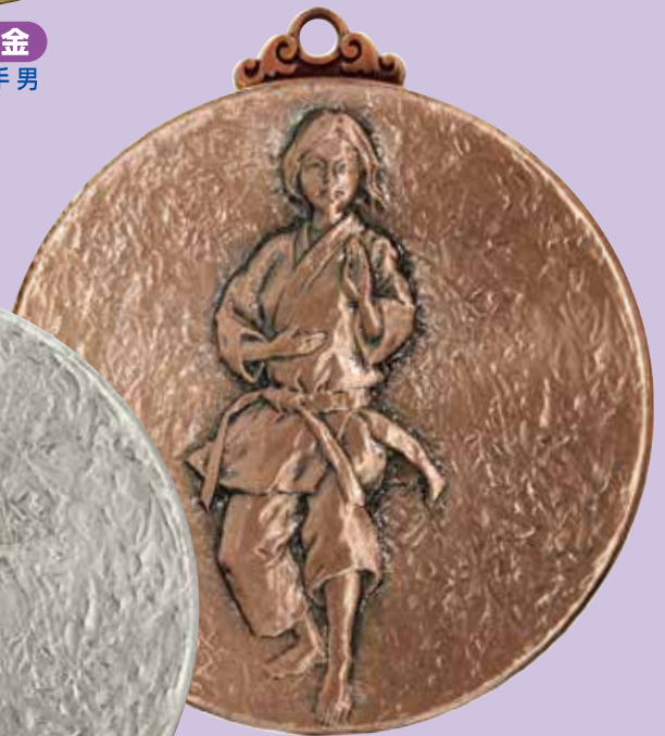
A80-185-銅 形空手 女