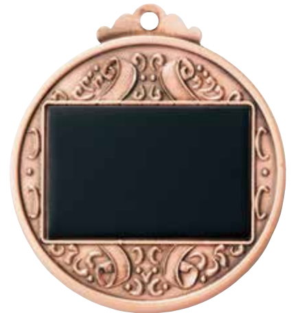
φ52mmメダル裏 (プレートは金・銀・銅とも黒色です)