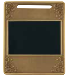
QUメダル裏 (プレートは金・銀・銅とも黒色です)