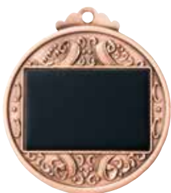
φ52mmメダル裏 (プレートは金・銀・銅とも黒色です)