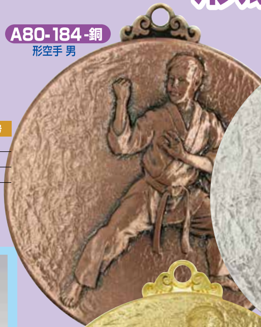
A80-184-銅 形空手 男