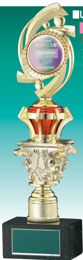
SH-7643-A (金色 取付け例)