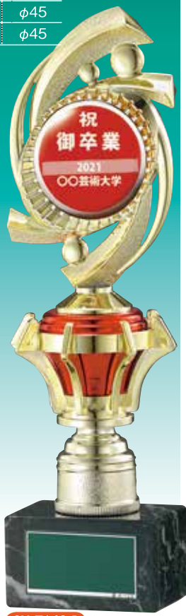
SH-7643-B (銀色 取付け例)