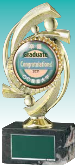
SH-7643-C (銅色 取付け例)